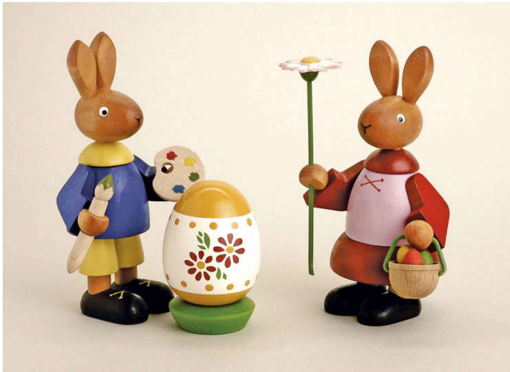
Sonst ist die Firma Blank aus Grünhainichen vor allem für ihre Faltenrockengel bekannt. Doch auch bei den Osterhasen beweist das Traditionsunternehmen einen guten Geschmack. © Blank, Grünhainichen