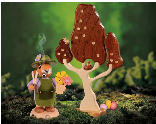
Wussten Sie schon, dass auch Osterhasen gern mal eine rauchen? Die Räucherhasen von Müller Kleinkunst aus Seiffen sind die nächsten Verwandten der berühmten Räuchermänner aus dem Erzgebirge. © Müller Kleinkunst aus dem Erzgebirge, Seiffen